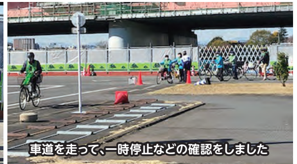
車道を走って、一時停止などの確認をしました