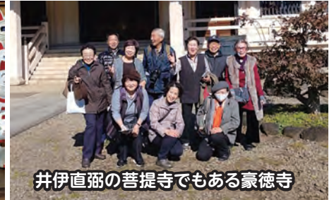
井伊直弼の菩提寺でもある豪徳寺