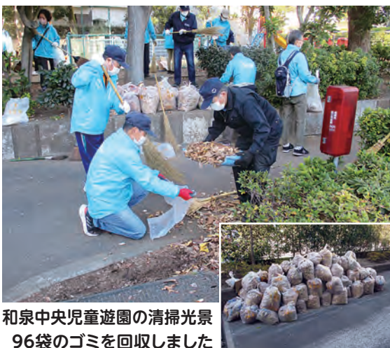
和泉中央児童遊園の清掃光景 96袋のゴミを回収しました

およそ1時間半の清掃でしたが、水色のジャンパー集団によって歩道も公園も見違えるほどきれいになり、好天にも恵まれて気持ちの良い汗をかいた1日となりました。