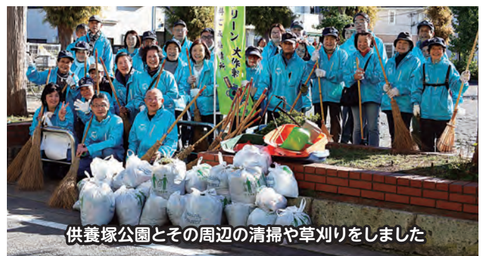
供養塚公園とその周辺の清掃や草刈りをしました

当センターでは昨年に続いて供養塚公園を担当し、園内の落ち葉拾いや周辺の草刈り清掃に心地よい汗を流しました。