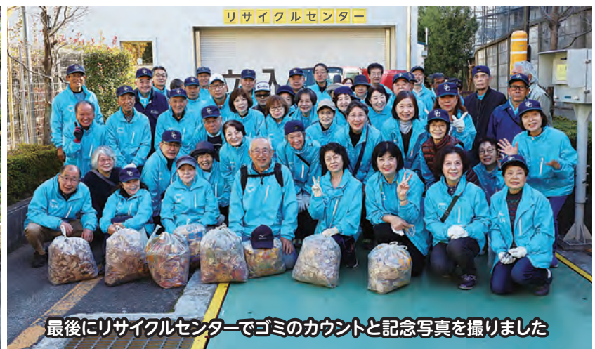
最後にリサイクルセンターでゴミのカウントと記念写真を撮りました