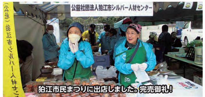
狛江市民まつりに出店しました。完売御礼!

当日は朝方の雨も上がり、多くの市民が押し寄せました。とりわけ甘酒は早々に午前中に、また味の染みたこんにゃくおでんも2時には完売になるほど好評でした。